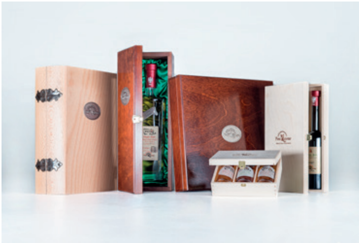
Geschenksboxen: Preise nach individueller Zusammenstellung